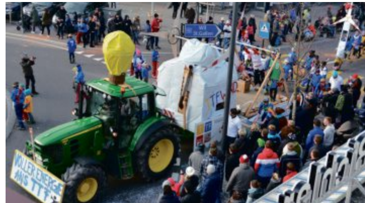
Ausblick aufs Turnfest 2017: Der TSV Wattwil und die Männerriege besuchten mit dem Thema «voller Energie ans Turnfest» die Wattwiler Fasnacht.

Bezüglich Jugendschutz hat sich das OK zum Ziel gesetzt, ein sicheres Wettkampf- und Vergnügungsareal für Jugendliche und